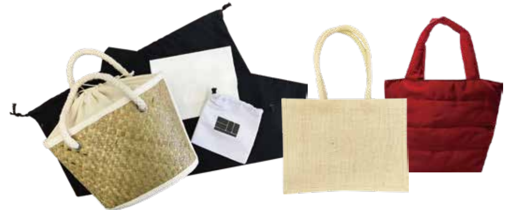
オリジナル商品・ノベルティ